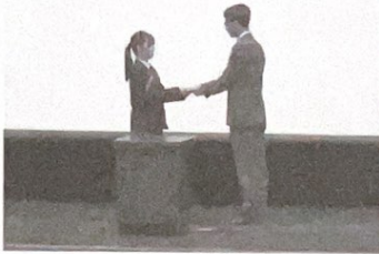
ワイヤー錠の寄贈

4月26日（金）鹿児島情報高校において、教職員、生徒 1450人に対し、自転車利用者の安全な乗り方や不審者に対応する防犯講話、SNS等による不適切な利用行為及び非行防止などについて、交通・防犯教室を行いました。 また、当防犯協会からは入学した1年生の自転車利用者に対して自転車ワイヤー錠を寄贈しました。