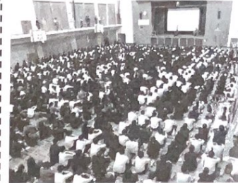
交通・防犯教室の状況

4月26日（金）鹿児島情報高校において、教職員、生徒 1450人に対し、自転車利用者の安全な乗り方や不審者に対応する防犯講話、SNS等による不適切な利用行為及び非行防止などについて、交通・防犯教室を行いました。 また、当防犯協会からは入学した1年生の自転車利用者に対して自転車ワイヤー錠を寄贈しました。